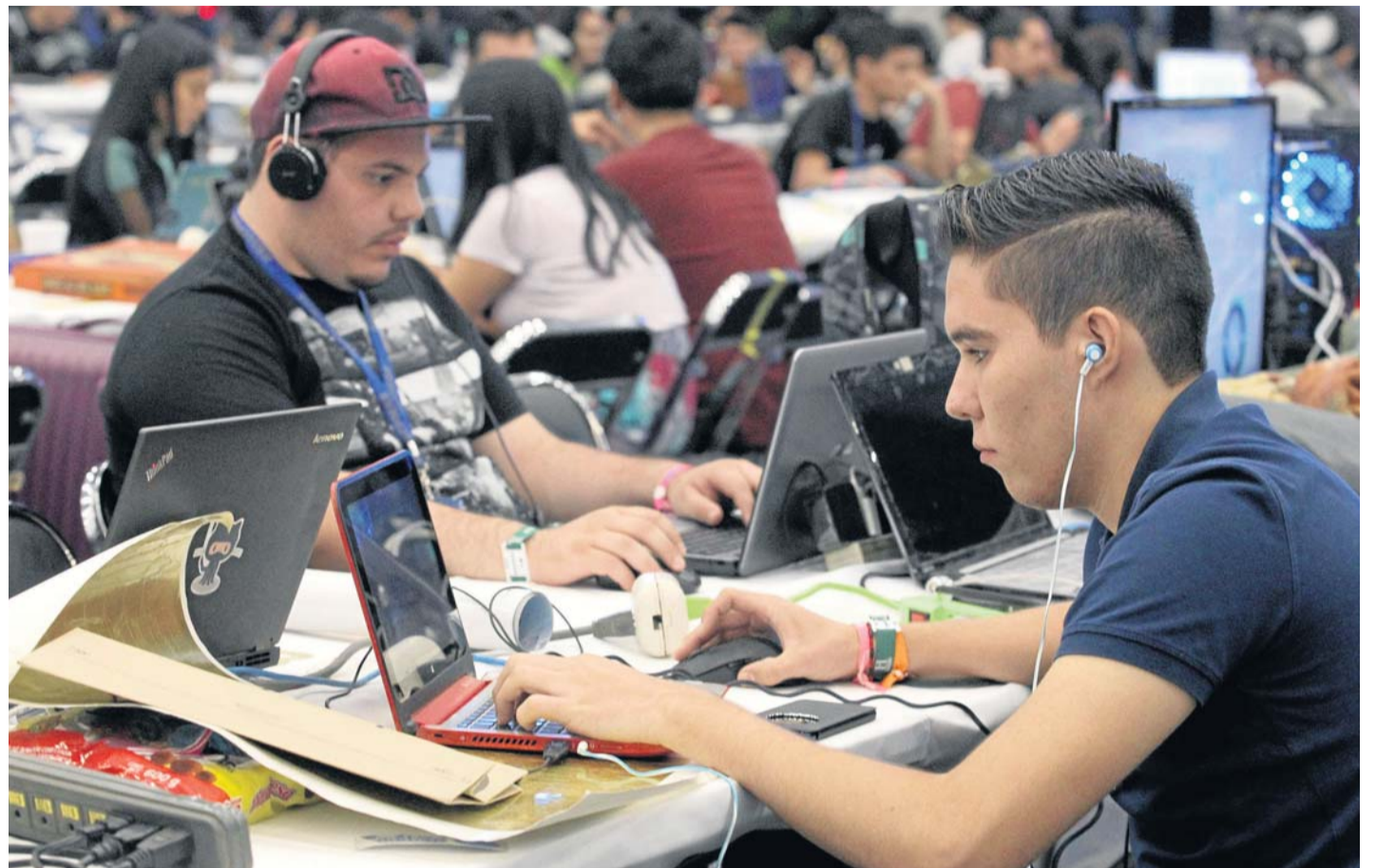
Sie hauen in die Tasten: Hackathons sind ein Veranstaltungsformat, das in der Programmierszene immer beliebter wird. In einem abgesteckten Zeitraum werden so häufig minimal-vorzeigbare Programme oder Produkte erstellt. Der „Healthcare Hackathon“ (Plakat unten) im Rahmen des „Gesundheit morgen“-Events legt den Schwerpunkt auf Ideen im Gesundheitsbereich.

„Unsere Philosophie ist: Wir haben kein spezifisches The-