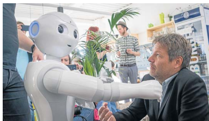
Erster Kontakt: Minister Robert Habeck trifft in seinem neuen Fachbereich Digitalisierung auch auf Roboter.

Seit dem Regierungswechsel ist der Grüne neben Energiewende, Umwelt und Landwirtschaft auch für Digitalisierung zuständig. Wie er den Bereich aber politisch gestalten will, versucht Habeck auf seiner Sommertour zu durchdenken: Nach dem Besuch eines Rechenzentrums passt dazu die Vorstellung in Kiels Gründerszene, der Starterkitchen.